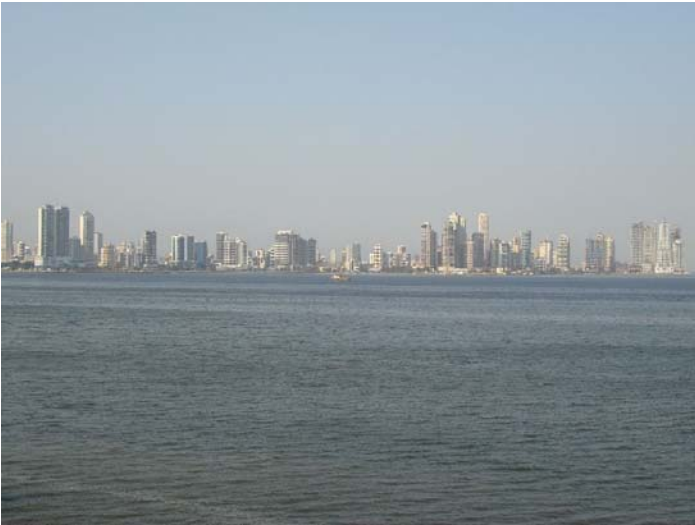
Panamá sede del diplomado